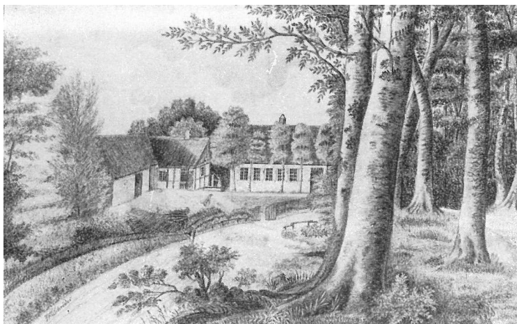
Ulfshus ved Haderslev